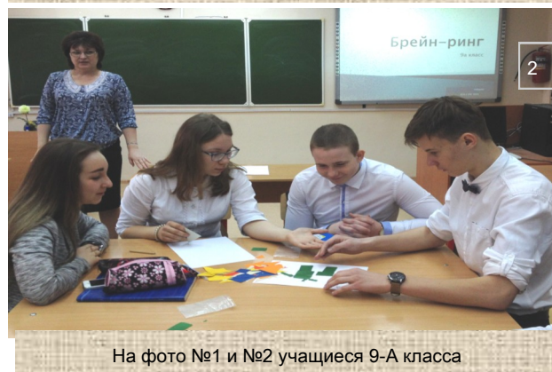
На фото №1 и №2 учащиеся 9-А класса

учебной деятельности, к познанию жизни и самого себя, а также выработки самодисциплины и самоорганизации.